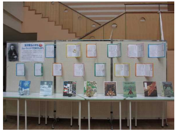
▲6年生が、国語の時間に宮沢賢治の絵本の紹介をつくり、全校児童にも見てもらいました。