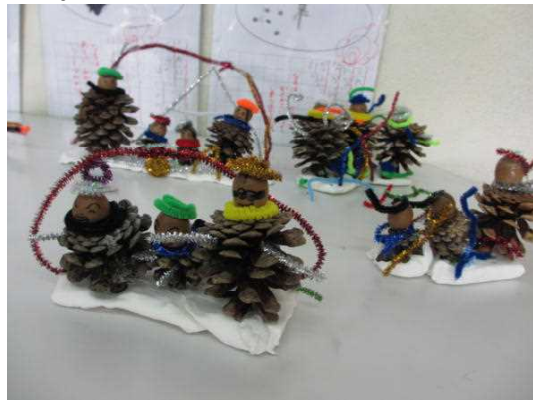
▲ 松ぼっくりや木の実で作った置物