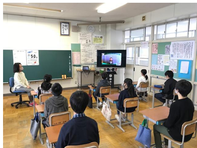
リモート会議システムを使っでの始業式